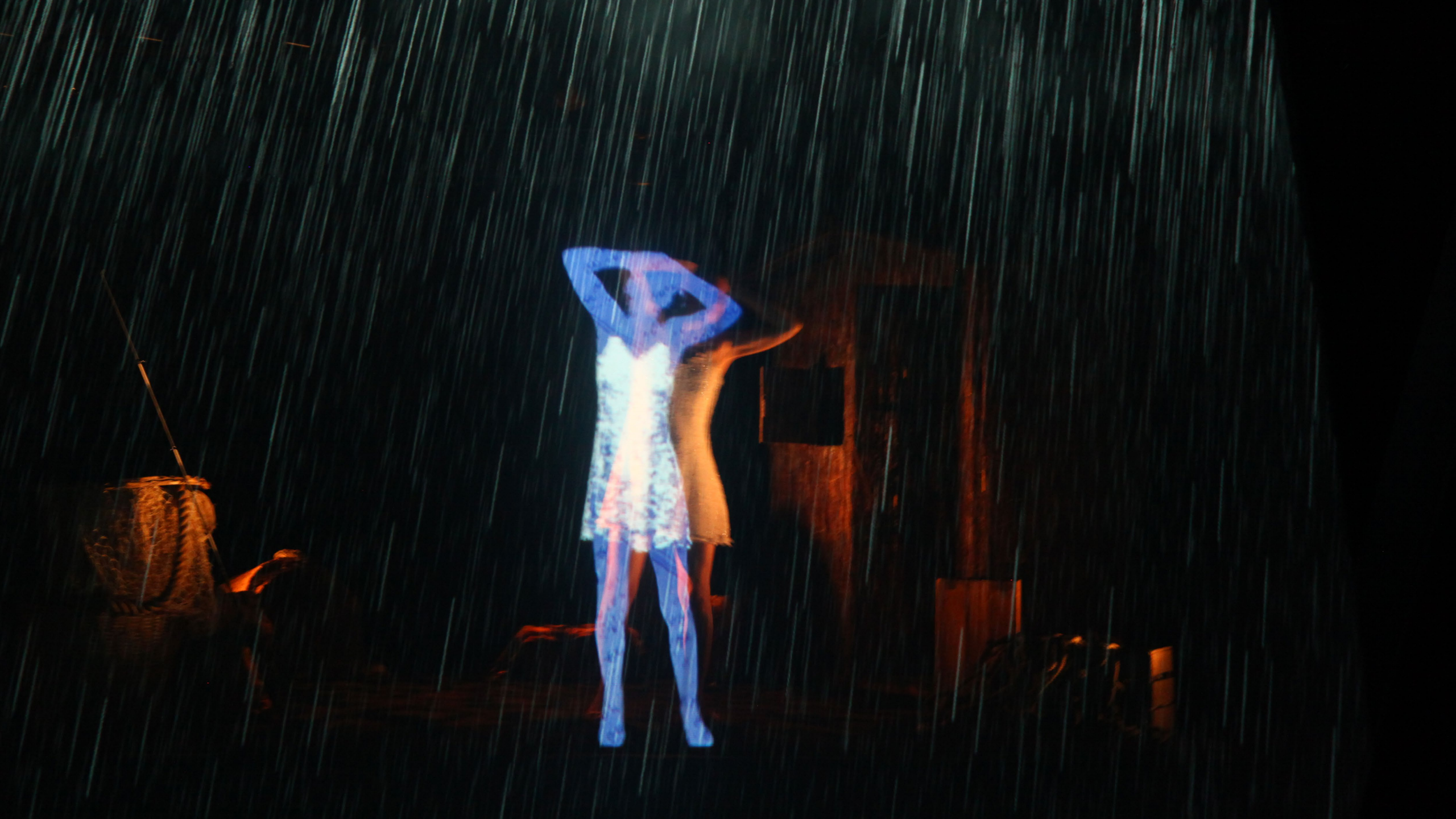
La source des contes, un conte holographique Mise en scène et adaptation Jacqueline Zouary Création visuelle Nikolas Chasser Skilbeck Compagnie les réminiscences / Centre des arts Enghien-les-Bains 2014