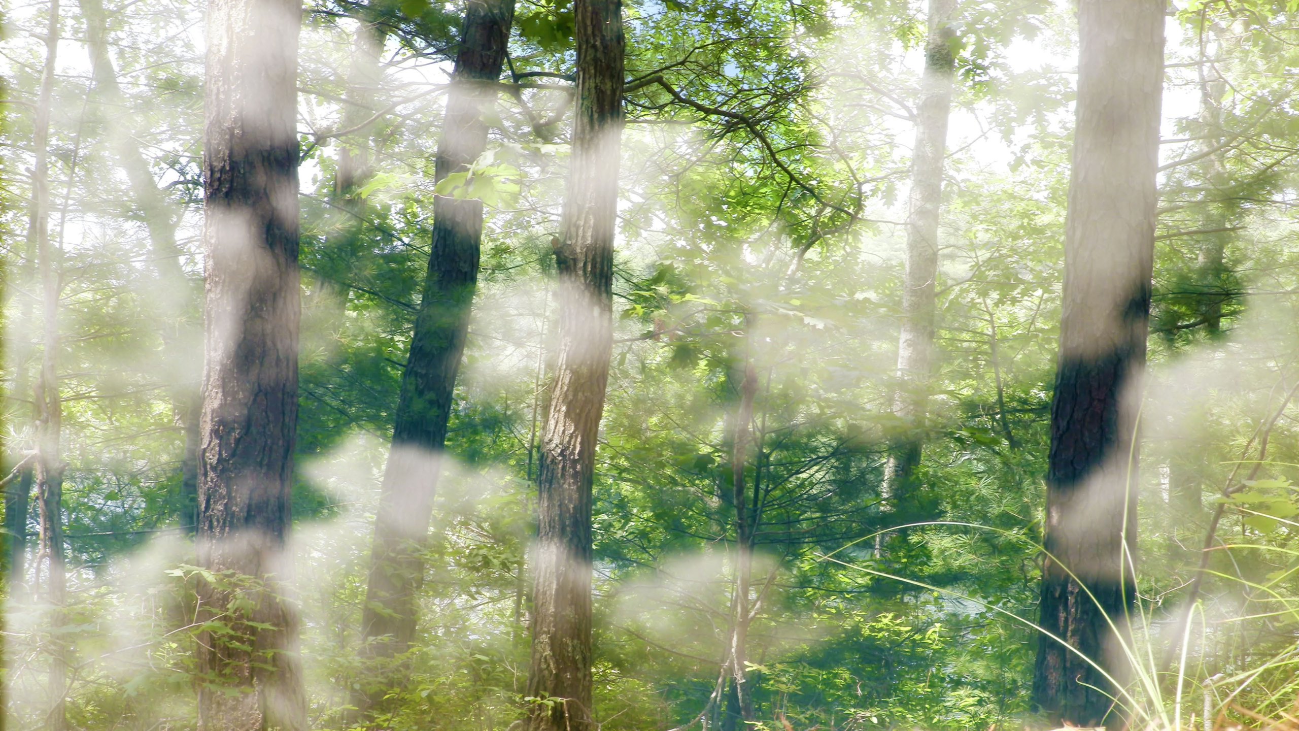
The forest Impression sur papier Fine Art, montage dibond 131 cm x 75 cm Nikolas Chasser Skilbeck 2024