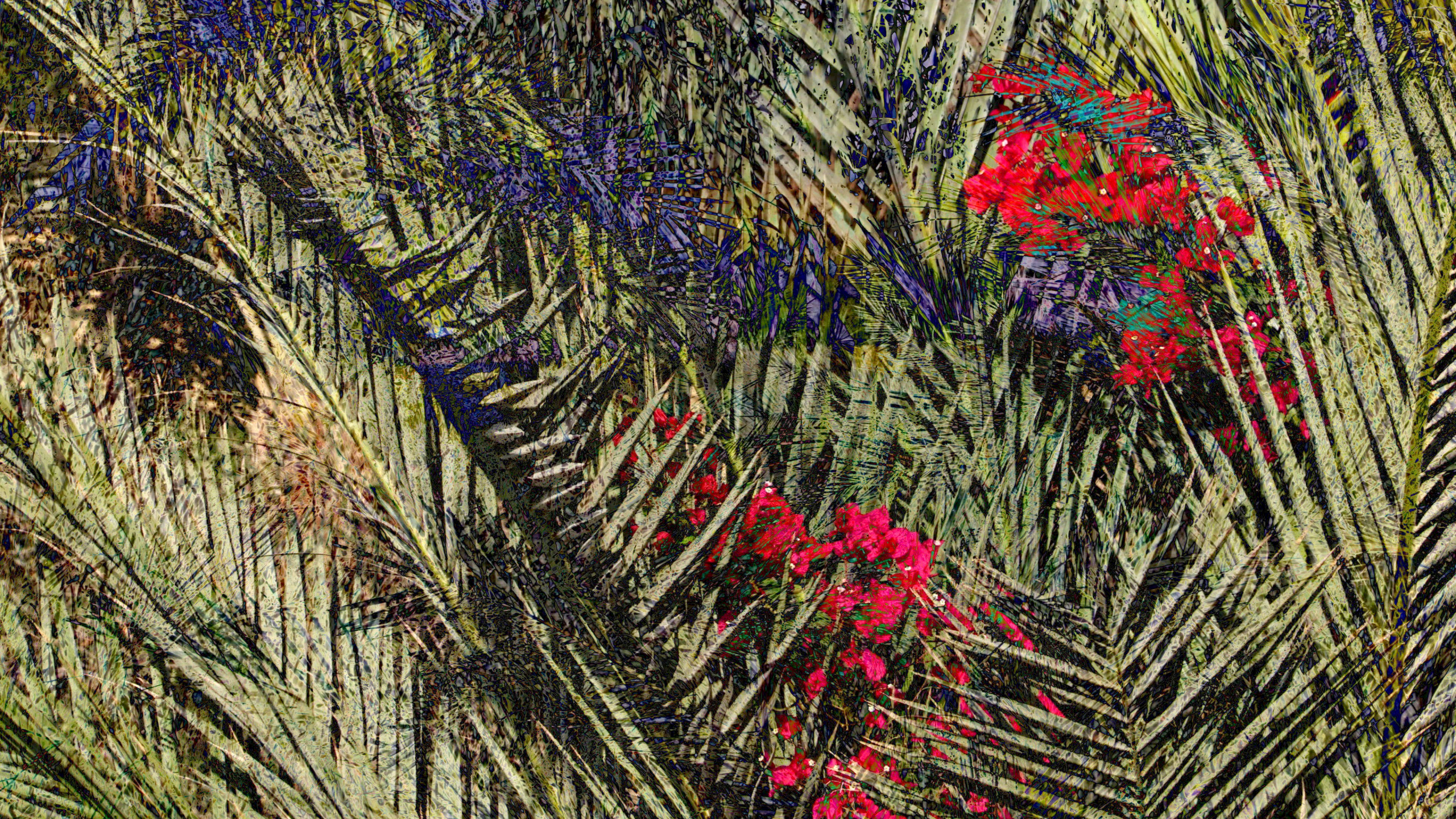
Through the Palms Vidéo 4K, 10'00" Nikolas Chasser Skilbeck 2020