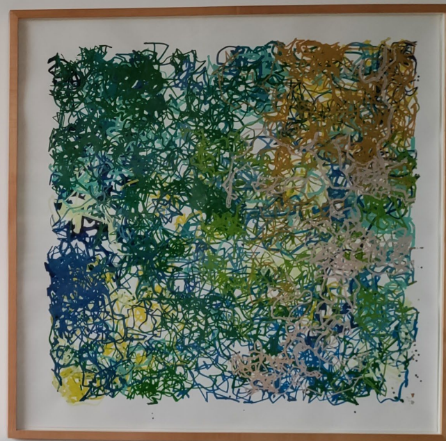
Vue de l'exposition collective Colourful Horizon à la Galerie Charlot à Tel Aviv. Nikolas Chasser 2021