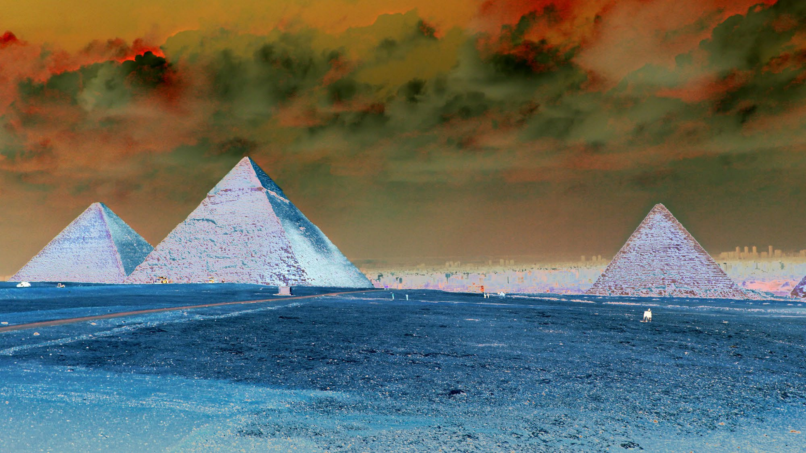
Ancient Dreams Vidéo 4K, 05'20" Nikolas Chasser Skilbeck 2019