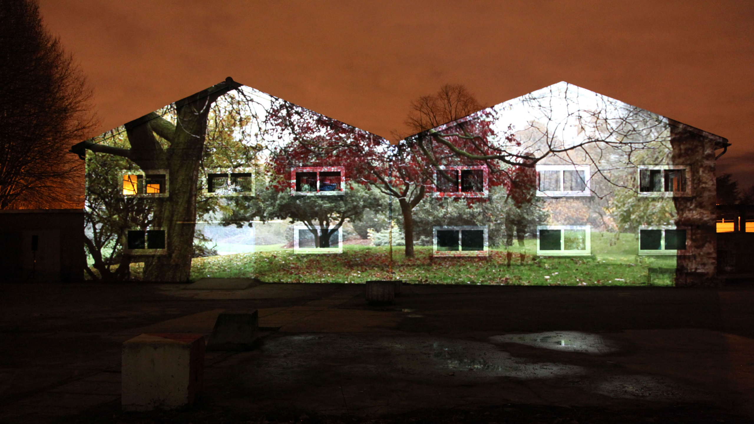
Dreaming of Trees Installation audiovisuelle Résidence MAC/VAL à Chérioux. Nikolas Chasser Skilbeck - Arthur Zerktouni 2013