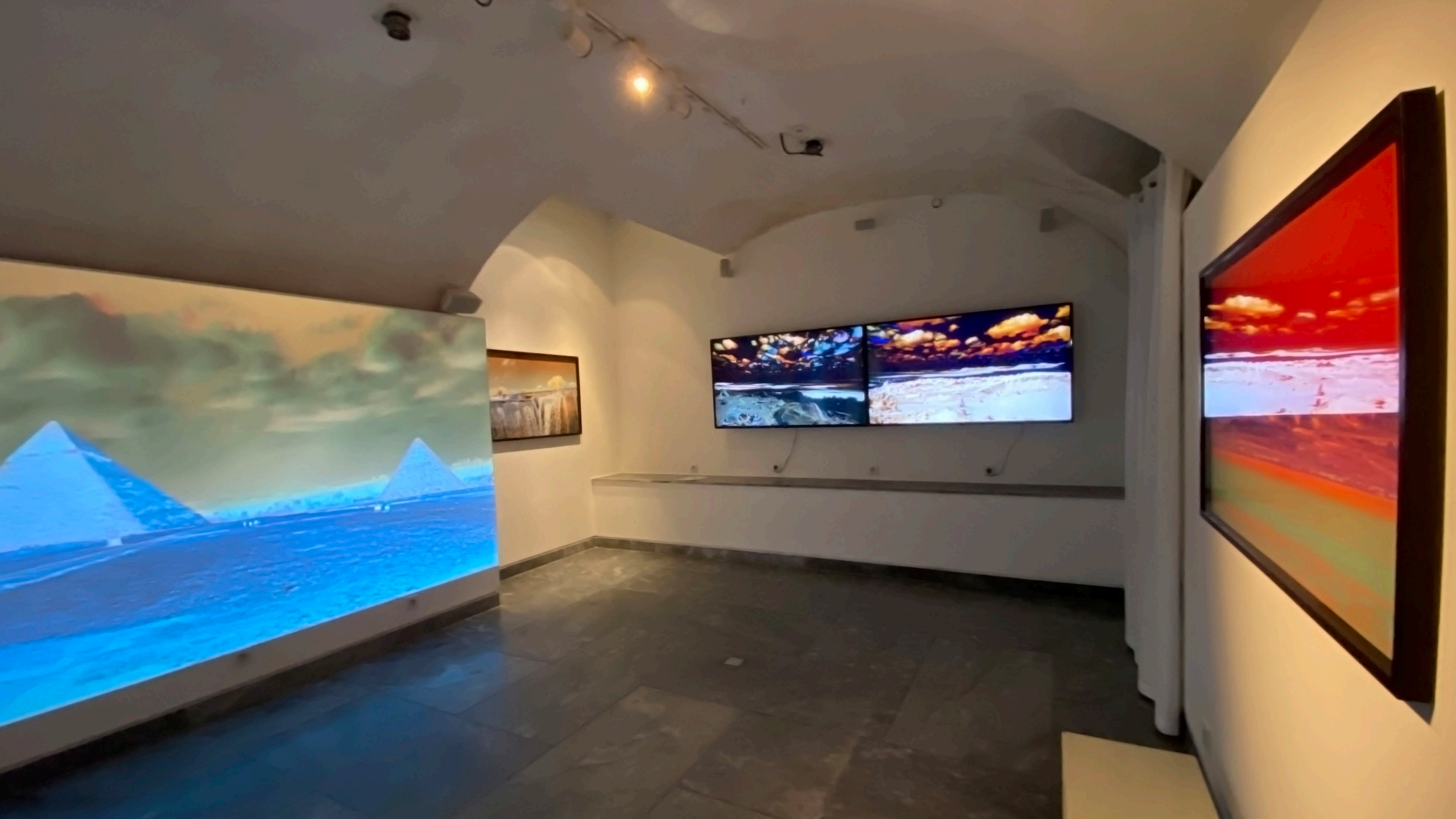
Vue de l'exposition personnelle Egyptian Paths à la Galerie Charlot à Paris. Nikolas Chasser Skilbeck 2020